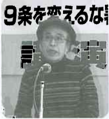
9条を守るな 11/5 安川教授の講演の様子

十一月三日(金)、「九条の会」事務局長の小森陽一氏(東京大学教授)を講師に「憲法を守る運動の到達点と今後の課題」について、五日(日)は「九条の会」講師団の安川寿之輔氏(名古屋大学名誉教授)を講師に「一万円札から