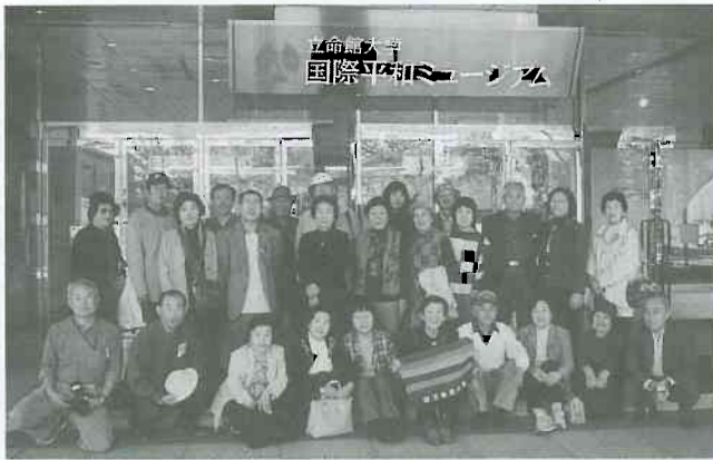
▲ 平和ミュージアムの前で記念撮影 ▼ 壁画「火の鳥-未来-」

早期五時五十分「富山医療生協9条の会」バスツアーは二十七名を乗せて京都に向け出発。途中休憩を取りながら十時三十分「もみじの永観堂」に到着。本格的な紅葉の時期より若干早いようですが境内を染め上げる紅葉はももちろん、回廊のすぐ前にも色鮮やかな風景があり「みかえり阿弥陀像」など拝観しました。お昼は京料理を味わい皆さんご満悦。午後「立命館大学国際平和ミュージアム」を見学。一階の広いラウンジの東西の壁面には手塚治虫氏の「火の鳥」が描かれ過去と未来が虹のかけはしでむすばれていました。窓際には「ムツちゃん平和像」が置かれ、この博物館の平和への願いが見事に表現されていると感じました。私たちは四班にわかれボランティアの方の詳しい説明に時間のたつのも忘れて熱心に見学しました。本