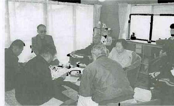
▲ 西部支部運営委員会での打ち合わせ

仲間増やし年間目標達成 西部支部(五福・桜谷・神明校区)は、年間目標(三十五名)を超過達成しました。強化月間にあたり運営委員会では全員が力を出し合い、医療部会提起の物産品争奪戦にも挑戦する事になりました。支部の役員は、町内会長、民生委員、環境衛生、看護関係など日頃から地元結びついてきました。月間中も統一行動日や青空健康相談、未組合員を含む楽しいレクリエーションなどを成功させてきました。また、公的病院からの早期退院の相談を五件ほど受け感謝されました。今後も「医療・介護なんでも相談」の窓口を広げ、三目標とも達成する意思統一を行い、新しい年を迎えます。(五十嵐)