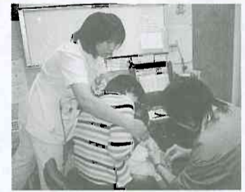
▲ 水橋診療所では小児の予防接種も

仲間増やし年間目標達成 西部支部(五福・桜谷・神明校区)は、年間目標(三十五名)を超過達成しました。強化月間にあたり運営委員会では全員が力を出し合い、医療部会提起の物産品争奪戦にも挑戦する事になりました。支部の役員は、町内会長、民生委員、環境衛生、看護関係など日頃から地元結びついてきました。月間中も統一行動日や青空健康相談、未組合員を含む楽しいレクリエーションなどを成功させてきました。また、公的病院からの早期退院の相談を五件ほど受け感謝されました。今後も「医療・介護なんでも相談」の窓口を広げ、三目標とも達成する意思統一を行い、新しい年を迎えます。(五十嵐)