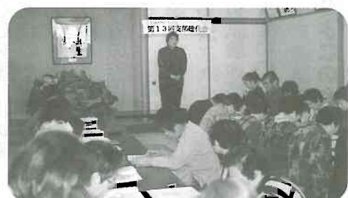
3/30 水橋支部 西浜班 滑川のみわ温泉で班会 あいにくの寒さの日でしたが、体はほかほか