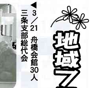
3/21 舟橋会館30人 三条支部総代会

3/25 えがお17人 医療生協山室支部が地域に呼びかけ「やまむろ9条の会」が発足。体験談の交流や、役員を選出した。