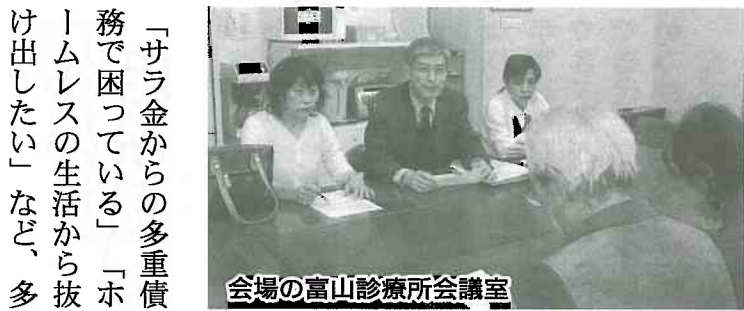
会場の富山診療所会議室

富山診療所では、昨年十月より富山民医連の協力もえて「くらし・福祉なんでも生活相談」を行なってきました。