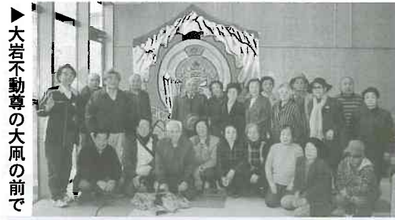
大岩不動尊の大風の前で