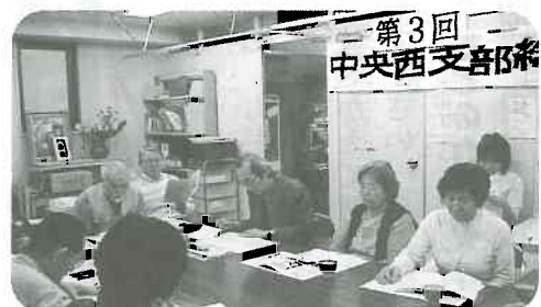
▲3/28 富山診療所15人 中央西支部総代会