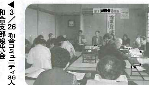
3/26 和合コミュニティ36人 和合支部総代会