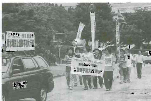
▲支線・富山南コース 細入から富山市役所へ向けスタート

トシ医療生協からのべ二一〇名が参加し県内九つの自治体を通って十七日に石川県に引き