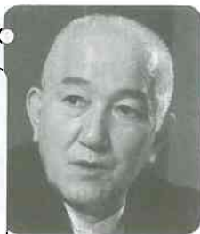
米倉 齊加年 俳優