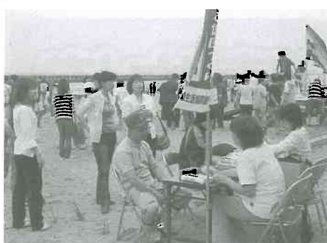
▲クリーン作戦後の健康チェック

今年も六月二十五日 富山市八重津浜と氷見 市島尾海岸で富山県生協連主催の「海岸クリーン作戦」が行われました。