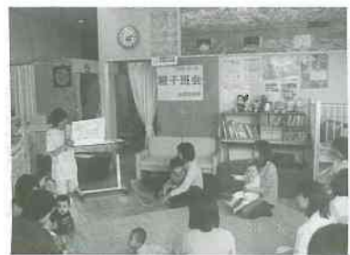
▲水橋診療所待合室での親子班会