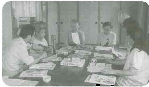
▲6/22 健診準備班会 (針原新庄支部、一本木班)