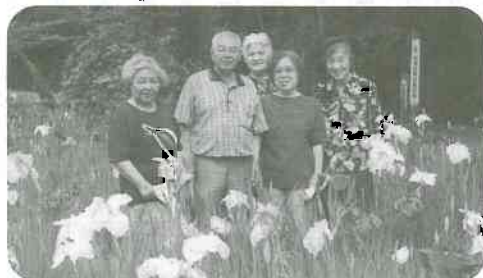
▲6/23 経田公園しようぶ観賞 (水橋支部、西浜町班)