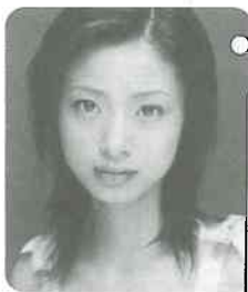
上戸 彩 女優

八重津浜では和合支部の組合員さんをはじめ医療生協から二〇人ほど参加しました。ゴミ拾いの後、会場で恒例の健康チェックを行いました。