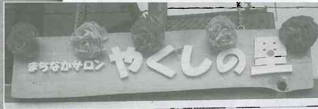
▲ 組合員手づくりの看板

二階なども使って、ボランティアの皆さんの活躍で「折り紙講習」や「健康チェック」などが行われました。やくし支部では、これから高齢者から子どもまで、誰でも気軽に集える場として展開していく予定です。当面、月、水、金の