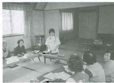
▲説明を受けながら健診準備班会