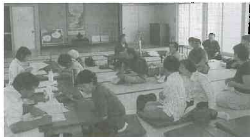
▲出張健診班会の様子