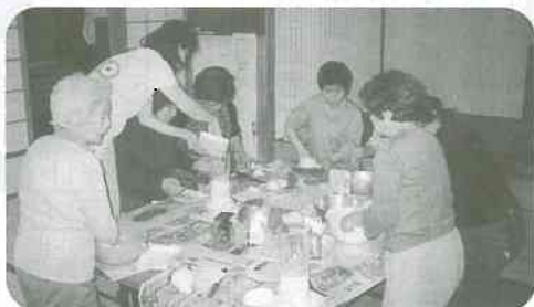
▲6/6 こぎぶり団子づくり (水橋西部支部、川原町班)