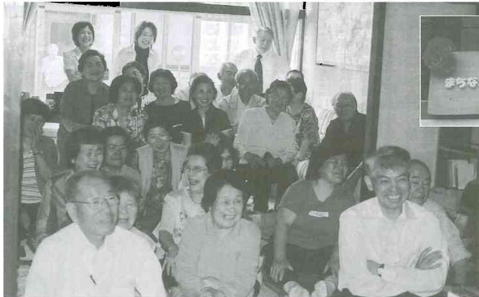
▲ ユーモアいっぱいの講演にたのしそうなみなさん

2006年 7月号 No. 280 〒931-8501 富山市豊田町1-1-8 ☎076-441-8351 FAX 076-432-8031 ホームページアドレス http://www.toyama-hcoop.com/ E-mail webmaster@toyama-hcoop.com 毎月1回発行 定価 1部 30円(組合員の購読料は出資金に含まれています) 発行 富山医療生活協同組合