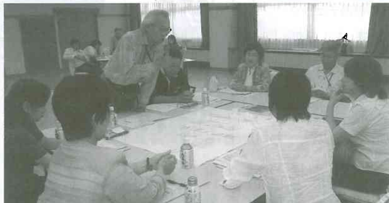
▲各グループごとに話しあわれた内容を報告