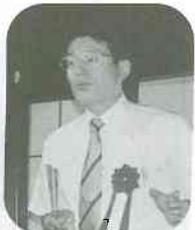
挨拶をいただいた舟橋立山町長