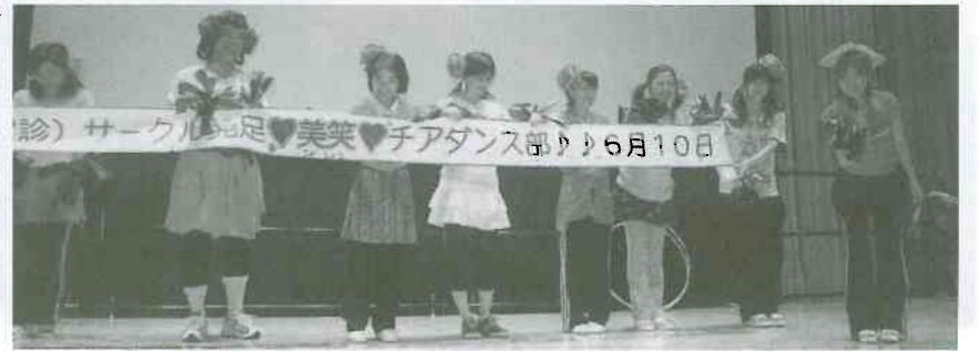
▲富山診療所チアダンス部「美笑」結成を報告しました。(部員募集中!!)

六月十日(土)午後二時から、サンシップとやまにて「第十六回富山診療所まつり」が、三〇〇名の参加で行われました。当日は天候に恵まれて楽しいひとときを過ごすことができました。