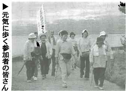
▶元気に歩く参加者の皆さん