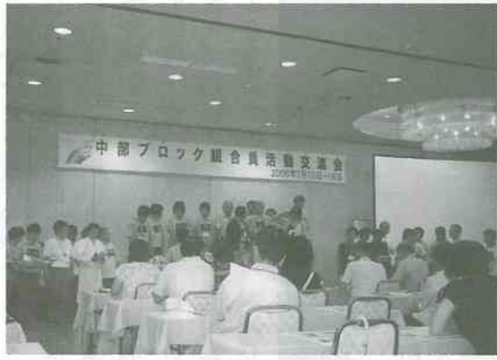
▲紹介された現地実行委員の皆さん

『健康をつくる、平和をつくる、頼りになる医療生協をつくる』をテーマに、七月十五日(土)に蒲郡・三谷温泉にて開催され、中部ブロック組合員活動交流集会は、①平和・社会保障②健康づくり③組合員が主人公の事業④くらし助け合い⑤支部づくり・班づくりの五つで、二十四演題ありました。富山からは六名が参加。全体会での報告と、三つの演題発表を行いました。