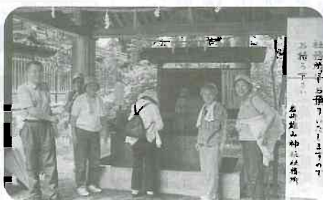
▲7/2 グリーンパーク吉峰でウォーキング(水橋西部支部)