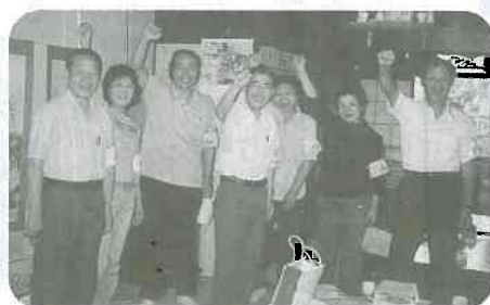
▲7/17 五百石町内で「やくしの里」宣伝行動。やくし支部