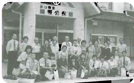
▲6/30~7/1 会津医療生協の方々が来県され、「ほがら」と「やくしの里」を見学し、帰中やくし支部の組合員と交流しました。

今年、「温泉でゆつくり交流を」の声に呼んで、滑川みのわ温泉で七月九日(日)に開催し、二十九名が参加。温泉を楽しんだ後、昼食交流会では、輪投げとじゃんけんゲームなどで、大いに盛り上がりました。帰りに、健診班会と健康チャレンジャーの取り組みについて話を聞きました。