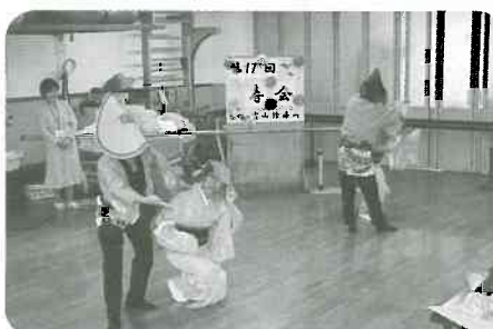
9/22 富山診療所「寿会」が85才以上の患者さんを対象にして富山協立病院リハビリ室で開催されました。25人の参加者皆さん笑顔でいっぱいでした。