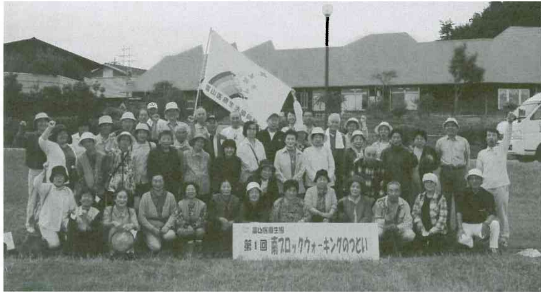
▲よしみねハイツ前で集合写真(南ブロック)

キングに参加された方が「楽しかった」と言って加入されました。広田支部でも、班会に参加している組合員さんが、知人や家族を紹介し、十月になって十五名が増えています。つながりを大切にしながら、元気で暮らしに役立つ取り組みを進めましょう。