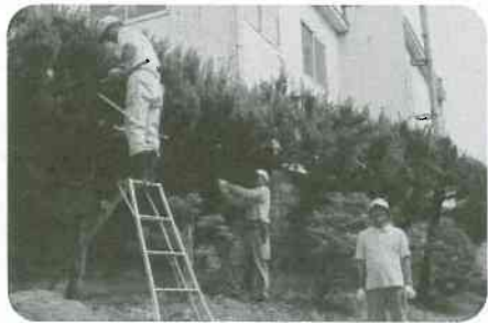
10/2 協立病院 植木剪定に4名のボランティア