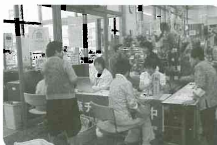
10/2 呉羽支部 健康相談会 45人の方利用