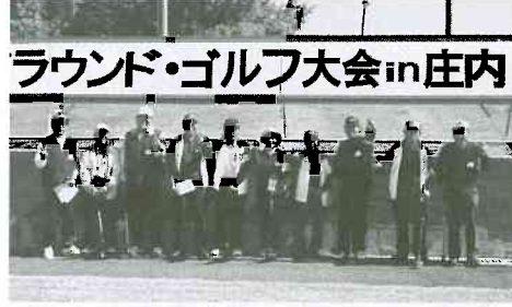
▲小真木原公園陸上競技場にて

十月十七日、十八日、山形県鶴岡市に於いて開催された大会に、富山大会団体優勝チームと個人戦上位入賞者五