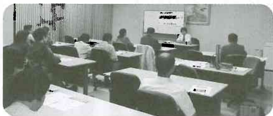
▲9/28 新川民商「後期高齢者医療制度」 学習会 16人(新川文化ホール)