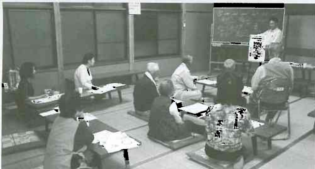
10月11日水橋西部支部立山町班、晩七時半から公民館を会場に「後期高齢者医療制度紙芝居と足指チェック」班会。参加10名。

「虹の出会い」月間(生協強化月間)は、後半に突入し総仕上げの時期に。いま、「後期高齢者医療制度を中止し安心の医療を」署名を大きく地域に広げようと、全支部と全事業所が協同して、地域の組合員さんや長寿会を訪ねる活動