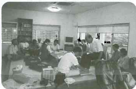
9/28 新堂班 「足指チェックと紙芝居」 13人