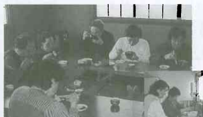
▲みんなで食べるとおいしいね!(陽だまりサロン)