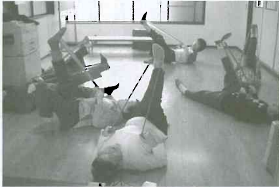
▲セラバンドで楽しい班会

職員が作成しました。楽しくて、わかりやすく、ためになる手作り紙芝居です。 班会で大好評です。いろいろな作品がありますので、ご活用ください。