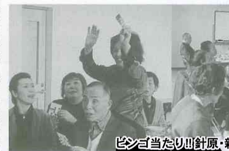
ピンゴ当たり!! 針原・新庄支部「新年会」

一月二十一日(日)支部新年会が針原地区センターで開催され、二十五名が参加しました。