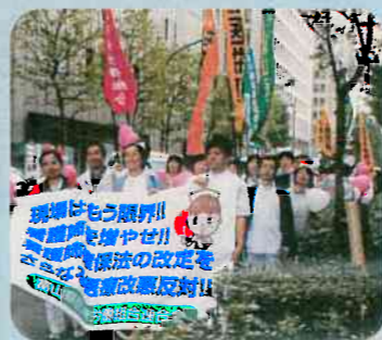
▲「看護師増やせ」要請行動