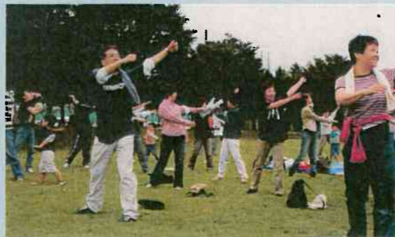
▲WHO ウォークイベント