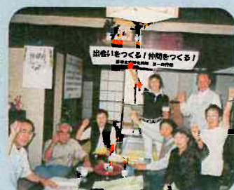
▲仲間を増やそう「せーの」行動(やくし支部)