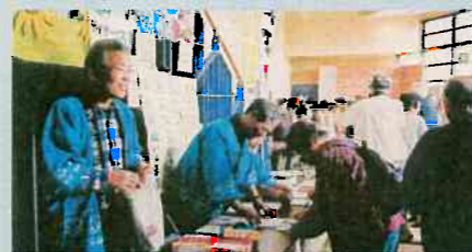
▲地域にすっかり定着した「水橋健康まつり」