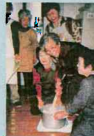
▲地域ふれあいサロン 里芋団子づくり(広田支部)