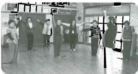
▲4月11日(金) 呉羽支部願海寺・野々上班「セラバンド体操」 17名参加