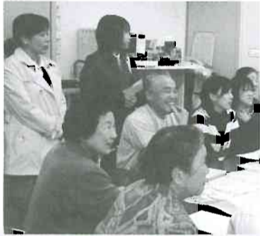
▲力を合わせて、笑顔で頑張りました

この行動から地域の受け止めが好意的で、期待されていることが伝わってきて、「飛躍委員会」が励まされました。富山診療所職員が窓口で熱