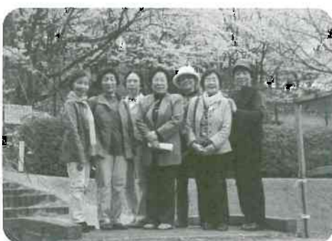
▲4月11日(金) 和合支部杏子班 7名参加「越中座見学と各願寺花見」