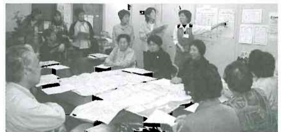
▲どこを訪問するか確認している様子

移転した富山市中心地域は、組合員も比較的少なく、新しい診療所を支えるために「富山診療所飛躍委員会」を発足。地域の組合員や診療所の職員を励まし、活動の中心になろうと行動を提起し、