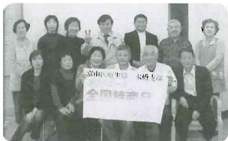
▲4月3日(木) 水橋支部 14名参加 全国特産品獲得のお祝い 高知の「かつおのたたき」おいしくいただきました