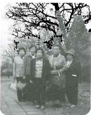
▲4月12日(土) 和合支部 四方荒屋班 5名参加「内山邸夜観桜の会」