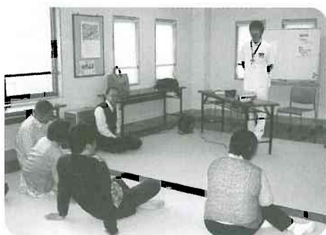
▲4月26日(土) 上市支部 自然房班「口と歯のはなし」 10名参加