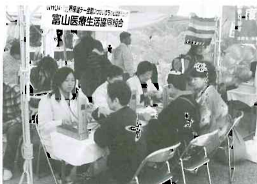
▲チンドンマンも健康チェック WHO世界保健デー チンドン会場にて

「世界保健デー4・7まちかどいつせい健康相談会」は、今年も四月五く六日のチンドンコンクール会場で開催されました。両日で組合員、医学生含めて二六名が参加しました。血圧チェックをしていた時、六十歳代の血圧を心配している女性から「健康診断も、健康チェックも結果が怖くて受けられないのヨ」と声をかけられました。「私も不安で怖いけど早めに異常が見つければ、軽いうちに直せるメリットがあります。医療生協の仲間です。定期的な受けてください」と体験を話しました。