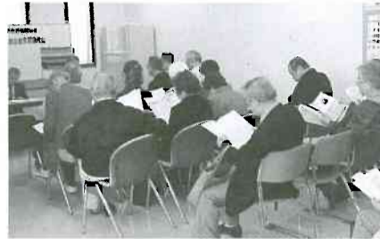
▲「えがお」で山室支部総代会

四月五日(土)山室支部では「えがお」の地域交流室で第八回支部総代会を開催しました。総代二十五名の参加で進められ、仲間増やし四十一名、増資は百三十七万七千円、班会七十五回の到達でおおいに元気の出る総代会となりました。