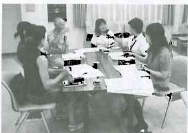
▲手話で楽しくトーク

目的で使用する人に対して、その目的が期待できる旨を表示」できるだけです。ましてや、「いわゆる健康食品」は何も謳う事はできません。この「いわゆる健康食品」には、多くのダイエット食品、ウコン・グルコサミン等の含有食品が含まれています。体験談を効果と間違えてはいけません。「メタボ健診」によつて、「健康食品」の市場が拡大するといわれている現在、正しい「健康食品」の使い方をし、健康食品で不健康にならない様にしなければなりません。