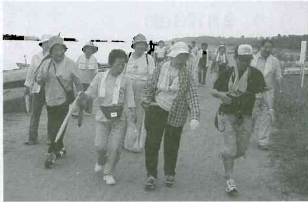
▲楽しく会話しながら歩きました

岩瀬支部では、「海の日」の前日の七月二十日、恒例の「海の日ウォーキング」を行いました。これまでも支部単独で行ったことがありませんでしたが、今年は北事でしたが、今年には北ブロックの各支部に共同の行事となるよう参加を呼びかけ、広田支部、大田支部、萩浦支部からも参加されました。