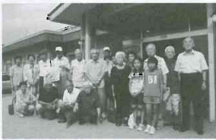
▲吉峰温泉の前で中央東支部の皆さん