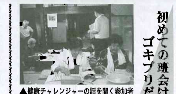
▲健康チャレンジャーの話聞く参加者

初めての班会はゴキブリだんご作り 滑川支部 中町班 七月二十三日の午後二時から私の家に七名の組合員が集まり、初めての班会を開きました。初めに、血圧チェックを行って、各自の日ごろの血圧値について話し合った後、「健康チャレンジャー」の 話を聞きました。早々に、二名の方が健康チャレンジャーに登録され、「私の健康ファイル」を手に入れました。暑いので首にタオルを巻きながら、たまねぎを刻み、注文分を含めて十二軒分のごきぶりだんごを、楽しく作り合いました。 角川淳子理事