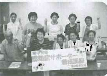
▲8月4日 婦中支部 11名参加「認知症サポーター養成講座」オレンジリングをいただきました