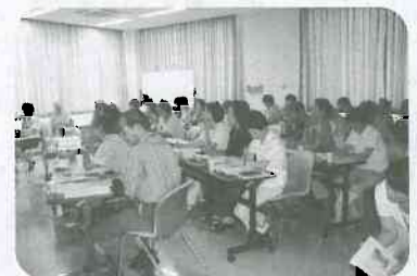
▲8月22日 ひまわりボランティア学校 40名参加「認知症サポーター養成講座」