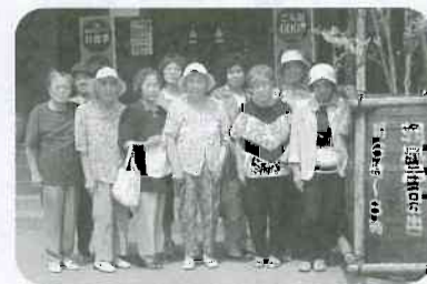
▲8月5日 水橋西部支部 花の井町班 10名参加「高岡・伏木」の庭にて温泉班会