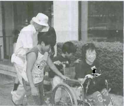
▲富診前で車イス体験中の親子

「着色料の実験で毛糸が怖いくらいに鮮やかに染まっていた」「日頃飲んでいるジュースについて考えさせられた」「診療所でいろんな画像を見ることができてよかった」等の意見が寄せられました。また、子供たちは「夏休みの自由研究にしよう」と