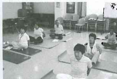
▲真剣にストレッチに取り組む受講者の皆さん