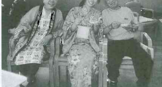
えがおデイサービス

いる胃・肺・大腸ガン検診は受けられなかったか。少し涼しくなってきた今が大変良いですよ。秋口になると風邪やインフルエンザが大流行するかもしれません。水橋診療所では、六月に最新のデジタル眼底カメラを購入しました。光量が少なく、処理が速くなり、より正確な診断ができるようになりました。健診や治療に、活躍中です。一年を通じて、全身の健診チェックを合言葉に笑顔・元気・安心を提供しようと思っております。