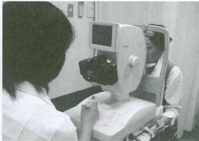
▲最新のデジタル眼底カメラ

水橋診療所では年間計画で全身チェックをするシステムづくりを目指しています。六月から実施された「特定健診」の検査内容ではメタボリックシンドロームを対象とした内容ですので、医療生協のオプション検査を追加することを勧められています。水橋診療所では出来ない検査もありますので協立病院と連携して