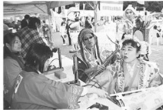
▲見物客のほかにもチンドンマンやマスコミの記者も大勢参加。健康チェックは、組合員十名とリハビリ科の新入職員を含めた職員二十五名を中心に行いました。

昭和三十年に戦争の傷跡から市民の心にも傷を取り戻そうと始まったチンドンコンクデーに合わせたコンクデーの健康相談会を四月四日(土)、五日(日)の二日間、県庁前噴水公園で実施しました。健康づくり委員会を中心に、組合員十名とリハビリ科の新入職員を含めた職員二十五名を中心に行いました。興味津々で測定していた方に、熱心に食事の相談にのるなど、皆さんに大変喜ばれた健康相談会となりました。リハビリ科の新入職員四人も先輩職員に操作方法や説明の仕方聞きながら、足指力チェ