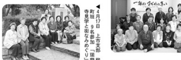
▲話題の映画を見に行きました

果がいやが上にもマップして画面を美しく感動を与えてくれました。映画鑑賞の後は、食事と血圧測定、入浴をして一日を有意義な班会で過ごしました。