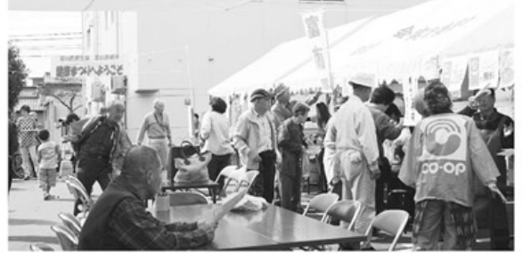
▲まつり模擬店コーナー、全店が完売しました

十月十一日(日)午前十時〜午後一時まで「富山診療所健康まつり」を開催し、二百四十名が楽しく集いました。