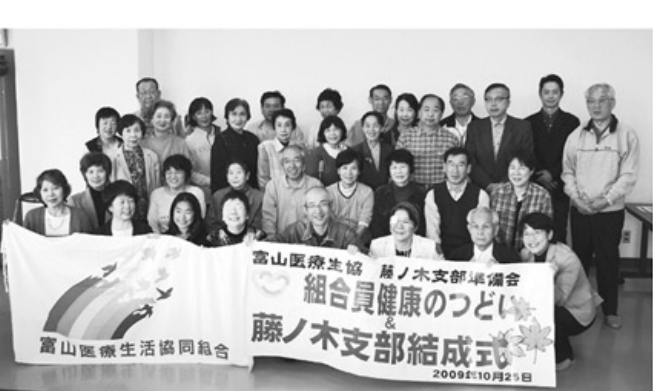
▲藤ノ木支部結成を喜び合う組合員さんたち

準備委員を増やす。等の三つの活動目標と十月末までに支部を結成することを決めました。準備会は、毎月地域訪問活動を行い、虹のまち配付係を新しく八名増やして、配付率を五七・二四%にしました。準備委員は二名増やしました。班会は富岡町・栄新町・藤ノ木緑台の三会場で開催しました。かかげた三目標をすべて達成して結成当日を迎えることができました。