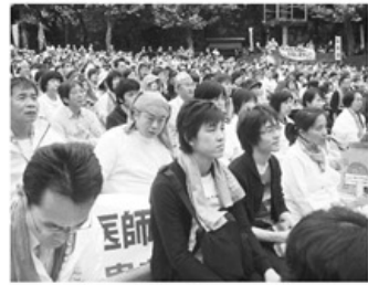
▲日比谷野外音楽堂での中央集会

【問題】カギを解き、二重ワクに入る文字をうまく並べてできる言葉は何？ ★たてのカギ★ ① により減刑 ② 47人の赤穂〇〇 ③ 100万―鉄腕アトム ④ おいしい獲物を前に ⑦ キーパーソンと同義 ⑨ 1足、2足と数える ⑪ 鋭利な刃物ではなくによる撲殺た ★よこのカギ★ ① 浦島太郎「桃太郎」など ⑤ 〇〇減製 ⑥ 方程〇〇を解く ⑧ 春菊の別称 ⑩ ポンド法 ⑫ 〇〇に火を灯す生活 ⑬ 4コマ、雑誌 ⑭ お茶の間の者 ⑮ 〇〇の深い顔立ち 【応募方法】 パズルの解答住所氏名年齢と、虹のまちの紙面や医療生協へのご意見・ご要望などがありましたら併せて明記の上ハガキ、又は富山医療生協ホームページ(一面右上に記載)の「お問合せ」メールにてご応募下さい。尚、虹のまちに掲載させて頂くことがありますのでご了承下さい。 【あて先】〒912-1850 富山市豊田町1-1-18 富山医療生協