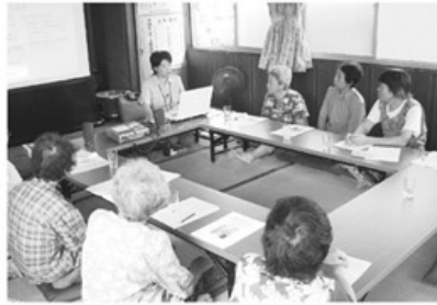
▲熱心に話を聞く入江班の皆さん

厚生労働省が勧めている認知症サポーター養成キャラバンに呼応して、まちづくり委員会では、「全支部でサポーター養成講座を開こう」と呼びかけています。三条支部では、運営委員が班や老人会に働きかけ、次々と認知症サポーターが生まれています。