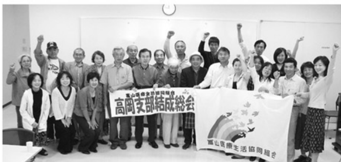
▲満場の拍手の下高岡支部が結成されました

十月四日ウイング高岡にて二十八名の参加で高岡支部が、また十月二十五日藤ノ木地区センターにて三十六名の参加で藤ノ木支部が結成されました。