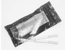
▲大腸がん検査キット