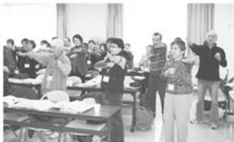
▲運動法を教わる皆さん