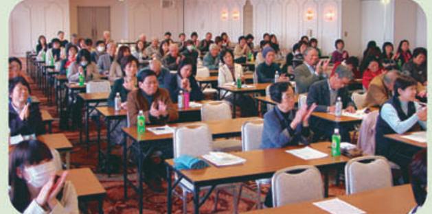
▲発表者に拍手を送る参加者のみなさん