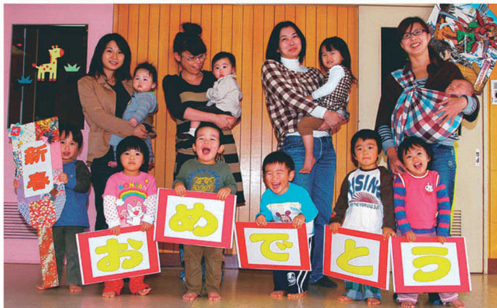
▲富山医療生協こぼと保育園の子どもとお母さん達

〒931-8501 富山市豊田町1-1-8 ☎076-441-8351 FAX 076-432-8031 ホームページアドレス http://www.toyama-hcoop.com/ E-mail webmaster@toyama-hcoop.com 毎月1回発行 定価 1部30円(組合員の購読料は出資金に含まれています) 発行 富山医療生活協同組合