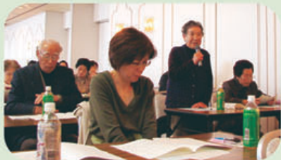
▲体験談を発言した組合員さん