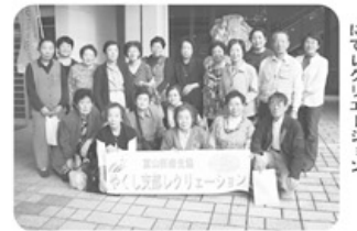
▲10月19日 やくし支部 19名参加「いこいの村健康展」にてレクリエーション