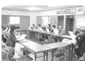
▲10月25日 和合ロース支部 布目旭町班 11名参加 強いいきいき班会