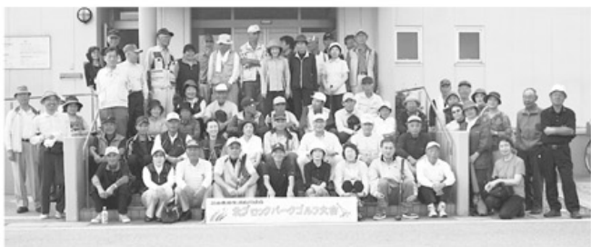
▲参加された皆さん。パークゴルフを楽しみました

パークゴルフ初心者の方も経験者の方もたくさん参加され生憎の曇り空でしたが、九十五名の参加者がスポーツの秋を満喫しました。各自二十七コースを周りその合計スコアで順位を決めました。日頃の練習を十分に発揮し、ホールインワンが続出するなどして、楽しく交流させていただきました。