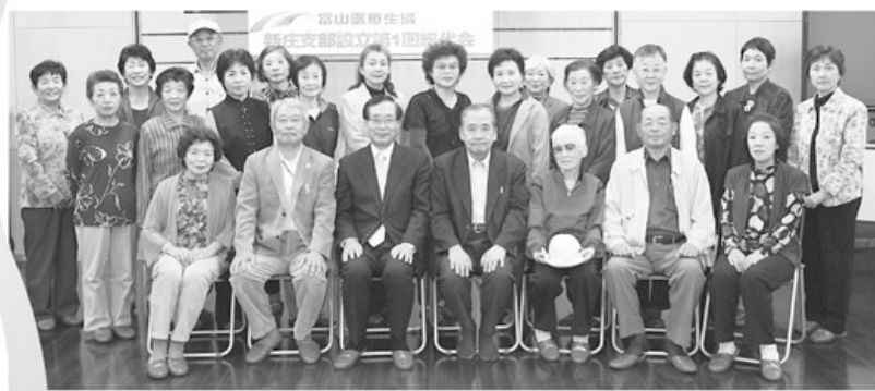
▲新庄支部総代会を終えて、参加者で記念写真

新庄、新庄北校区では医療生協の組織活動のひとつとして校区の環境保健衛生協議会主催の健康教室に協力し、地域と連携を築いてきました。新庄支部設立総代会では「組合員同士のたすけあいのネットワークを広げていくこと」、「健康づくりの活