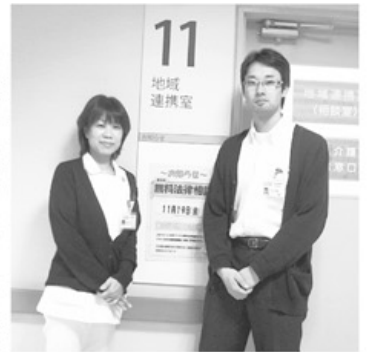
▲病院での相談は地域連携室へ

この制度は、経済的な理由により医療費の支払いが困難な方が、富山医療生協の協立病院・富山診療所・水橋診療所を利用した場合に、医療費の「一部負担金」や「自費払い」について、