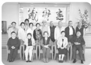
▲10月18日 中央東・中央西支部 19名参加「香り」にてレクリエーション