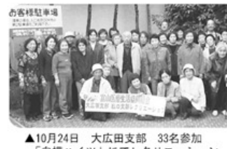
▲10月24日 大広田支部 33名参加「白樺ハイツ」にてレクリエーション