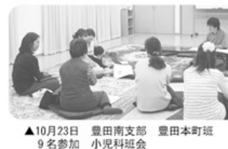
▲10月23日 豊田南支部 豊田本町班 9名参加 小児科班会