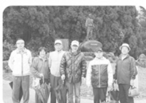
▲10月26日 藤ノ木支部 6名参加「ランドサンビ」にてウォーキング