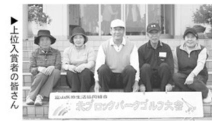
▲上位入賞者の皆さん