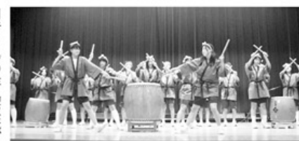
▲動きのそった演技

例年好評の模擬店では、虹の会「梅の湯元気塾」利用者の作品販売、農協婦人部の生け花、メルシークッキーなどとともに水橋支部、水橋西部、三条支部、滑川支部からの出店もあり所狭しと軒を並べて賑やかに開かれました。