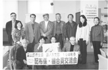
▲交流会参加者のみなさん