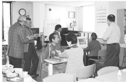
▲血圧・血管年齢チェックのようす

話聞きまし 硬化した予防の 護師から「動脈 院外来の鳥居看 て、富山協立病 血圧と血管年齢 に十二名が集い ました。初めに 時から、えがお （日）午前十一 一月二十四日 届けました。