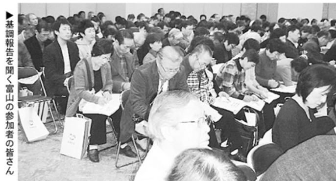
▶基調報告を聞く富山の参加者の皆さん