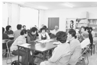
▲訪問行動の打ち合せの様子

三月二十三・二十四日の午後から、「しめくくり月間」最後の「いのちの対話大運動」として富山診療所の地元、西田地方校区組合員訪問行動が取り組まれました。 二日間でのべ組合員二十一名(南支部な