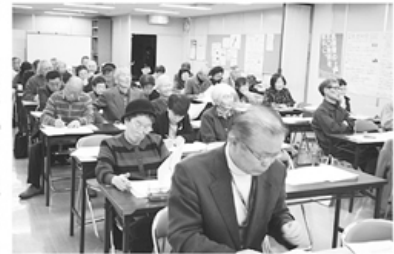
▲講師の話さきき参加者ら

くらしの学校は地域での助け合い活動をすすめるために毎年開催されます。今年も十六支部から四十七名の参加があり、新しい講座で盛況でした。