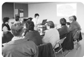
▲3月19日 高岡支部 チューリップ班 18名参加「認知症について」