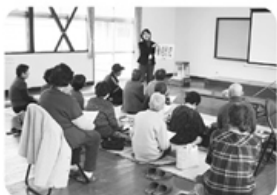
▲3月16日 浜黒崎・古志町班 14名参加「健康チェック班会」