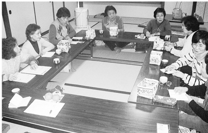
▲お茶菓子を用意して班会計話を話した杏子班のみなさん

〒931-8501 富山市豊田町1-1-8 ☎076-441-8351 FAX 076-432-8031 ホームページアドレス http://www.toyama-hcoop.com/ E-mail webmaster@toyama-hcoop.com 毎月1回発行 定価 1部30円(組合員の購読料は出資金に含まれています) 発行 富山医療生活協同組合