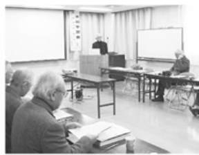
▲熱心に話をきき参加者

できました。カンパ物資も好調に広がりをみせています。国際署名も二千五百筆を超えました。各支部各事業所