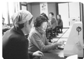
▲3月10日 針原・新庄支部 針原中町班 12名参加「血管年齢測定」