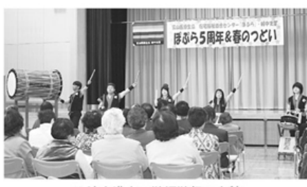
▲迫力満点の鶴坂鶴飼い太鼓

四月四日(日)、速星公民館におい て、総勢百人を超える参加者のなか ぼぶら5周年&春のつどいを開催し、