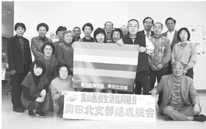
▲▼支部結成総会を終えて、参加者で記念写真

三月二十八日(日) 午前十時から「ひまわり地域交流室・ララ」で、記念となる第二十回奥田支部総代会が開催されました。医療生協で組合員千八百名を超す最大支部が、十九年間の活動を経て発展的に分割し、新しく「奥田支部」「奥田北支部」を結成しました。