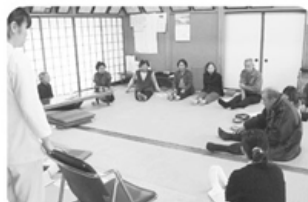
▲4月23日 三条支部 田伏班 8名参加 骨密度測定とこぼん体操