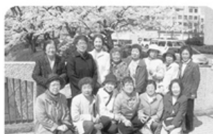
▲4月8日 広田支部 コスモス班 14名参加 お花見会