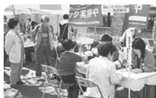
▲4月10・11日 チンドンコンクール 健康相談会 280名健康チェック