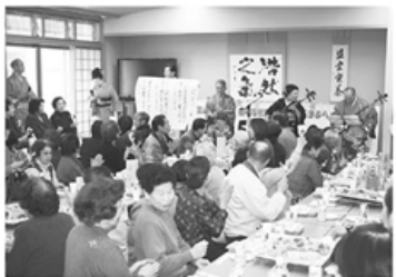
▲にぎやかに行われた第二部交流会

楽しく祝いました。 第一部は、鶴坂鶴飼い太鼓の元氣 の出るオープニングで幕開け。在宅 福祉総合センター「ぼぶら」が移転開 設し、組合員さんと職員がともに歩 んだ五年をスライドで振り返りまし