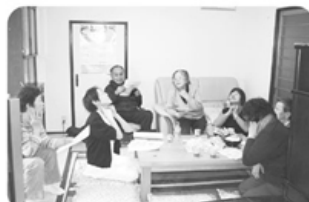
▲4月23日 西部支部 五福一區班 6名参加 血管年齢測定と動脈硬化について