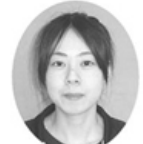
舟山小百合 社会福祉士 えがおデイサービス