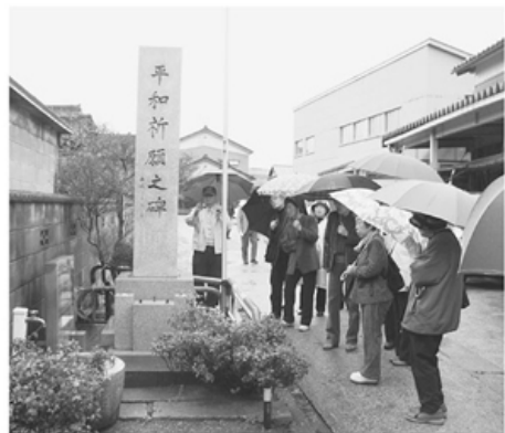
▲平和バスツアー参加者のみなさん

協「憲法9条の会」は、平和バスツアーをはじめ、これからも職員と組合員が協力して「平和と健康、住み