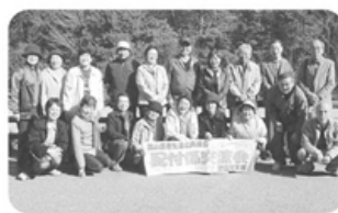
▲4月4日 豊田南支部 19名参加 配付係交流会