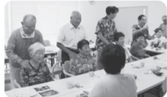
▲9月13日 水橋支部 高志園町班 18名参加 「楽しいいきいき班会」