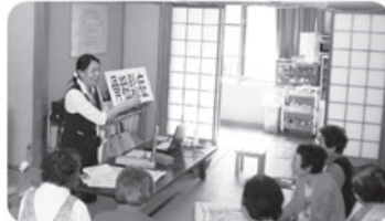
▲9月24日 岩瀬支部 秋浦町班 9名参加 「骨密度、大腸がんの話」