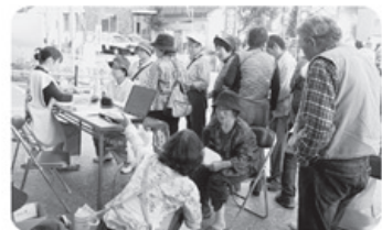
▲9月23日 高岡支部 かし祭りにて健康チエック 140名