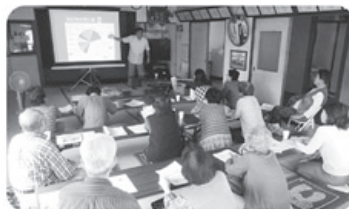
▲9月28日 富南支部 本郷町班 19名参加 「がんについての学習会」