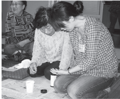
▲実際に尿チェックを行いました

九月二十一日(水)田畑北部公民館にて、尿チエック班会を開きました。 初めに協立病院の検査技師からスライドを利用した「尿検査と腎臓の働き」についての話しがあり、腎臓の働き、尿検査で知ることが出来る病気について学びました。 その後、蛋白やブドウ糖、潜血を調べることが出来るウロペーパーで尿チエックを行いました。班会を行う前は、尿チエックは難しい