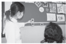
大きな治療の一つになっていくと思えます。そこで当院で行え

嚥下とは、食べ物や飲み物を口から食道に送り込む運動のことです。私たちは、食事の時に嚥下運動をくり返しています。しかし、様々な病気が原因で、嚥下がうまくできず、むせてし