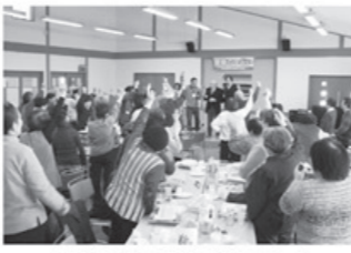
▲80名の方が参加されました

ぼぶら開設から六周年の新春の集いが二月十三日(日)に田島公民館にて行われました。当日は小雪がちらついていましたが、薄日もさし、開始の十一時には、会場は満席となりました。 来賓の挨拶で始まり職員さんの真面目な表情でのハンドベル、ハーマニカ演奏、日頃からボランティアで来て頂いている民衆会の皆さんの民謡おどりと、時を忘れて拍手、口ずさみ楽しみました。 フィナーレは、出演者の方々が会場へ参加の来賓方、組合員、職員皆一つになって「ぼぶら