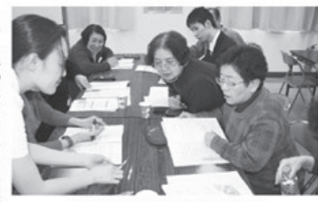
▲真剣に話に聞き入る皆さん

医療生協の保健係を対象とした「保健係交流会」が開催され、八名が参加しました。今回は「透析治療について」のミニ学習を行い、透析室の沿岸看護士を講師に透析治療の流れや、腎疾患について学びました。参加者は透析治療の器具や透析治療の内容について初めて目にするものも多く熱心に聞き入っていました。 学習の後は血圧測定の実習