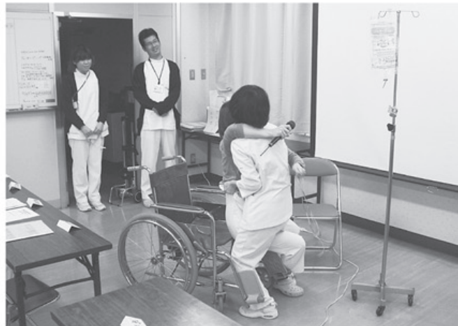
▲リハビリ科は劇で発表

2011年3月号 No.335 〒931-8501 富山市豊田町1-1-8 ☎076-441-8351 FAX 076-432-8031 ホームページアドレス http://www.toyama-hcoop.com/ E-mail webmaster@toyama-hcoop.com 毎月1回発行 定価 1部30円(組合員の購読料は出資金に含まれています) 発行 富山医療生活協同組合