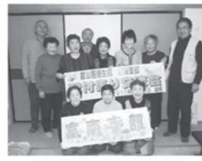
▲参加された組合員さん

恒例の配付者交流会が二月十九日(土)越州で開催され十三人の組合員さんが参加されました。 冒頭、支部長より日頃の配付活動に対するお礼と、三課題についてのお話がありました。皆さん自己紹介をしながら、日頃の配付活動の話などをされました。 参加された方からは、「声をかけられるのを待っている組合員さんがおられる」「配付は、見守りネットワークの役割も果たしているのではないかな」「もっと協力者を増やしたら、余裕を持って話せるのでは」といった声が開か