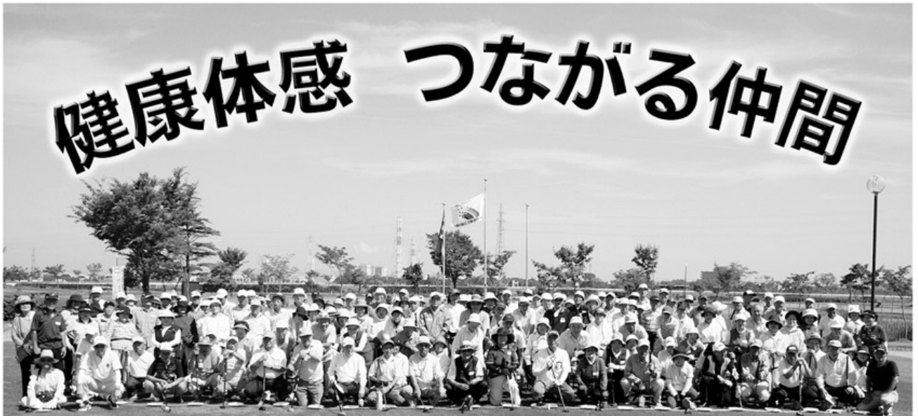
創立50周年プレ企画・サマーパークゴルフ大会に171名