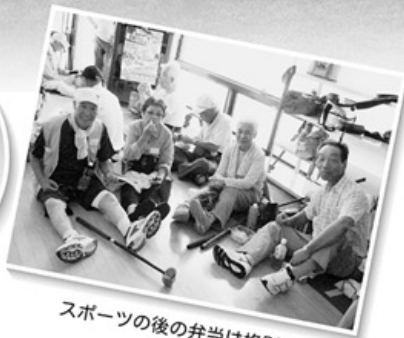
スポーツの後の弁当は格別!