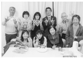
▲「I love you」の手話表現です

手話サークル「あいの手」もスタートして今年の四月で三年が経ちました。現在の会員数は十四名。中学生から七十代までの幅広い世代の仲間と手話での会話を楽しんでいます。聴覚障害者の方は、「聞こえない、聞こえない」として、周