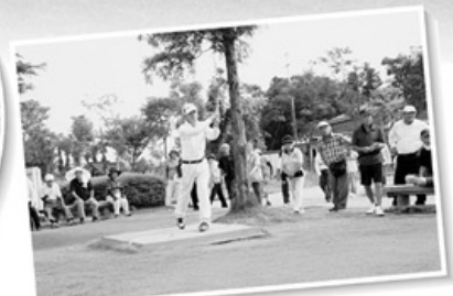
皆さんが見守る中でプレーオフ