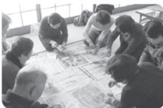
▲12月14日 婦中支部 寿・たんぼは合同班 13名 原チェック班会