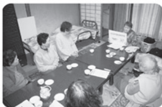
▲12月7日 南部支部 堅香子班 7名参加 暖かいきき班会