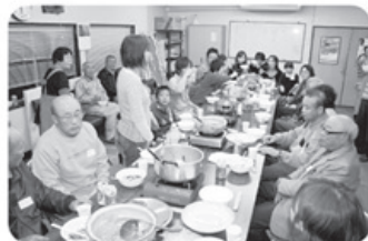
▲12月16日 豊田北・南支部 41名参加 支部・職員交流会