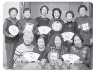
▲12月15日 広田支部 コスモス班 10名参加 クリスマス会