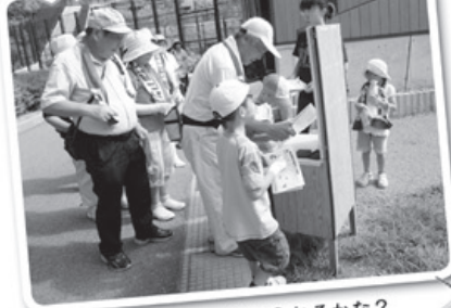
スタンプ7つ集められるかな?