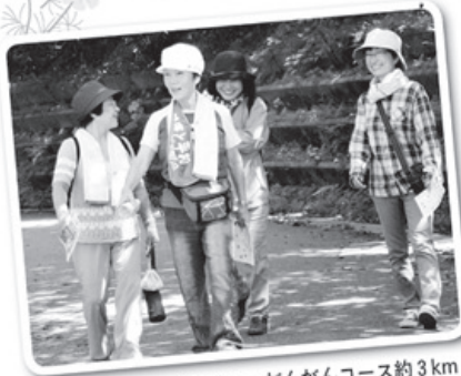
わくわくコース約1.7km、がんがんコース約3km