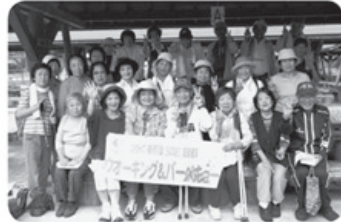
10月4日 水橋支部 25名参加 ウォーキング&パーベキュー グリーンパーク吉峰にて