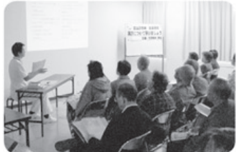
10月31日 富山診療所健康講座 42名参加 「漢方について学びましょう」