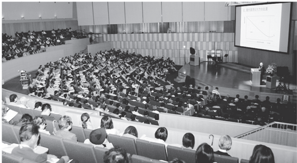
▲記念講演に800名、記念式典に700名の延べ1,500名が参加