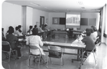
10月16日 和合ロース支部 21名参加 「医療生協50周年・和合支部17周年のつどい」