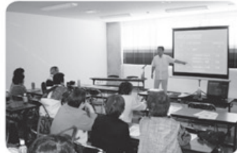
10月12日 若瀬支部 17名参加 「がんのはなし」