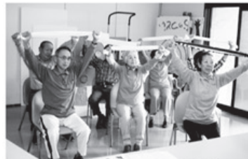
▲タオルを使ってせらばん体操