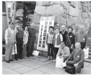
▲富山県から15名が参加

富山県からは、初参加と久しぶり参加の方が八名、連続参加の方が七名、健康を気にしながらの八十歳を過ぎた方も含め、十五名全員、元気に楽しく行ってきました。全国から延べ五千