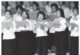
▲ドリームコーラス隊