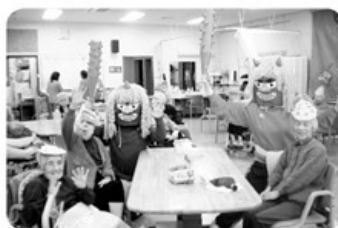
◀きすな 2月1日～3日 節分豆まき