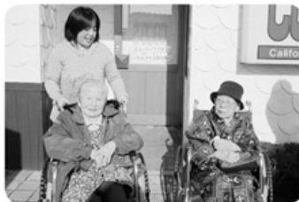
◀ほふら 2月16日 外食レクリエーション