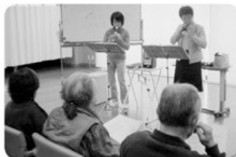
◀えがお 2月8日 ハイモニカコンサート