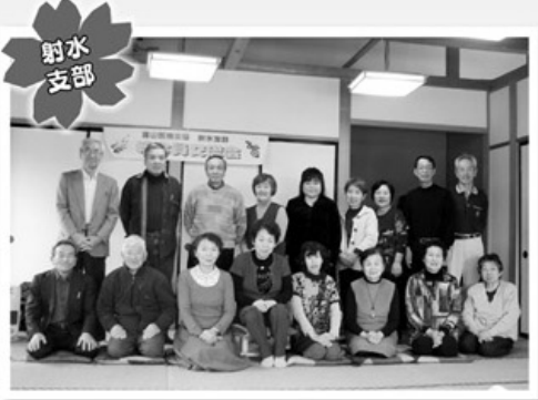
2月24日 組合員交流会 18名参加