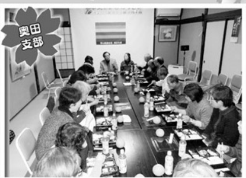
2月4日 新春のつどい 21名参加