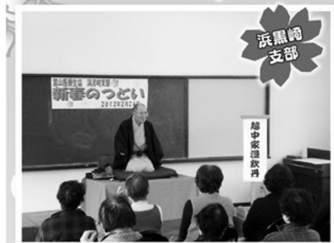
2月24日 新春のつどい 30名参加