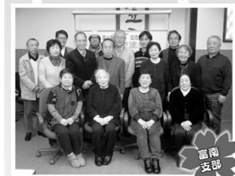
2月25日 配布係交流会 16名参加