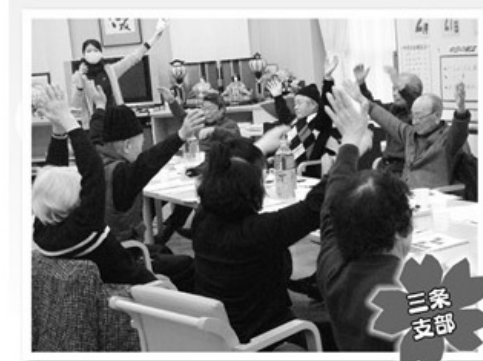
2月26日 配布係交流会 20名参加