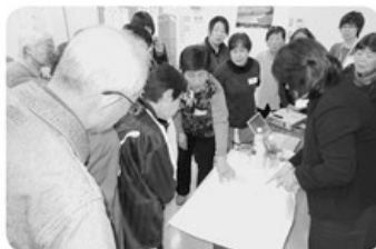
◀ひまわり 2月23日 介護教室「排泄について」