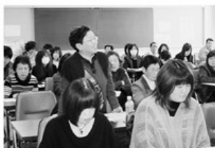
▲分散会での活発な意見交流

地域や地域の学校と協同しながら認知症を支えるまちづくりがすすんでいくことが報告されました。実際に学習した子どもたちは「自分のおじいちゃん、おばあちゃんも認知症になっても正しい対応をしたい」「自分もずっとこのまちに住み続けたい」と、認知症への理解を深めているそうです。 参加者からは「本当に認知症を支える」には子どもも大人も全部含めて、認知症の理解が必要だし、その働き掛けが大事だと改めて感じた」「子どもも、大人も一緒に取り組める活動はみんなが元気になる」などの感想が聞かれました。 まちづくり委員会