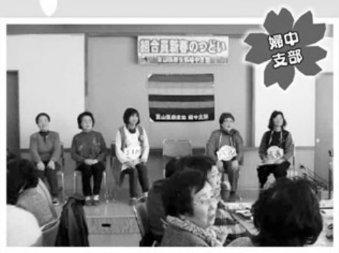
2月5日 新春のつどい 86名参加