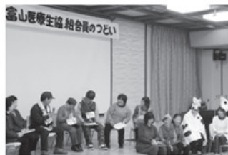
▲婦中支部おらっちゃん劇団の皆さん