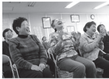
▲笑いに笑った「笑いヨガ班会」

二月二十四日(金)、協立病院会議室において、定数二十七名中二十五名の出席で第十回理事会を開催しました。 【主な内容】 ① 一月の事業概況と経営取支について確認しました。 ② 第五十九回常総代会の ③ 理事会専門委員会規程を改定しました。 ④ 年度末、支部総代会を課題達成の中で迎えること、特に増資目標の達成について協議し意思統一しました。