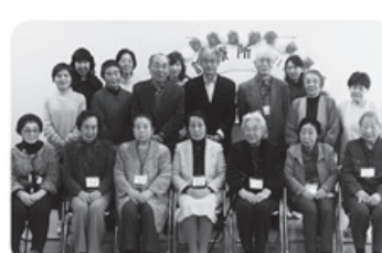
▲3月24日 富山診療所にて14名参加「第21回寿会」