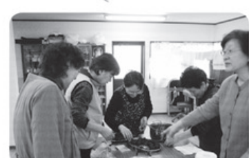
▲3月3日 和合ロース支部 布目東町班 10名参加 桜餅づくり班会