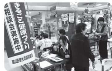
▲3月7日 水橋支部 ミニバスにて健康相談会 24名健康チェック