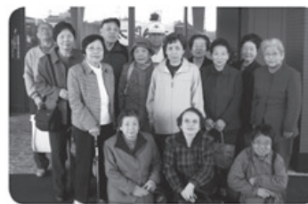
▲3月29日 秋浦支部 14名参加 温泉班会「太閤の湯」