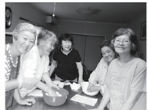
▲初めての班会に笑顔

以前から城川原で班会を開こうと色々考えていたところ、ゴキブリだんごづくりの話聞いて時期的にも「これだ!」と思い、声をかけると四名の方が参加されました。だんごを作った後は、脳いきいき班会のリラククス体操、音読などで また、次回の開催について、今回だんごを作ったけれど食べられないので、八月は小豆島のソーマンを食べよう、九月はおはぎかミヨウガ寿司を作ろうなど話は盛り上がりました。そ