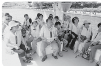
7月16日 南部支部 29名参加 支部レクリエーション 「富若運河水上ライン」