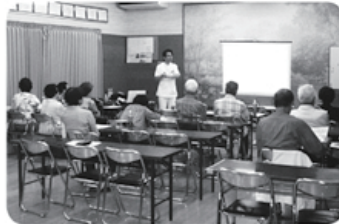
6月16日 大田田支部 さんもちせい班 16名参加 「健康食品のミカタ」