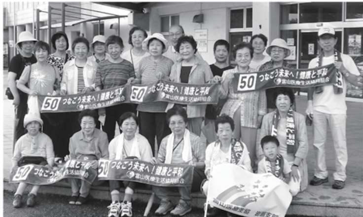
▲岩瀬支部 海の日ウォーキング “50周年がんばります”