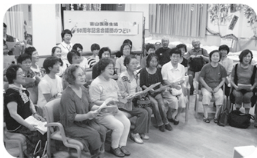
▲記念行事にむけ合唱曲の練習をする組合員さんたち