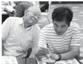
▲塩分の多さにびっくり

参加者からは「生協の理念や歴史を知り、自分達が学びながら広げたい」という感想がありました。 午後からは「ライフデザインノート」「糖度計・塩分計でわかること」「じゃがいもで簡単おやつづくり」と医療生協の魅力である三つの班会を体験しました。