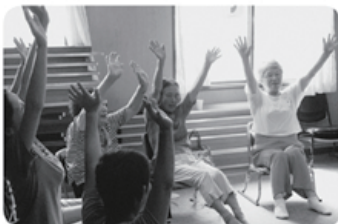
7月23日 和合八重津支部 さつき班 14名参加 「笑いヨガ」