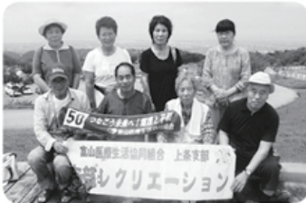
7月21日 上条支部 8名参加 支部レクリエーション 「新川育成牧場でパーベキュー」

六月三十日(土)、協立病院会議室において、定数二十七名中二十四名の出席で第一回理事会を開催しました。 【主な内容】 ①五月の事業概況と経営収支について確認しました。 ②第五十九回通常総代会の概況について確認しました。 ③監事指摘事項の「減資の取扱いについて」協議し確認しました。 ④総代会方針の実践にあたり、各支部への援助の為にブロック別理事で協議しました。