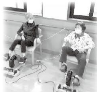
足漕ぎマシンでのリハビリ

あります。また、デイサービスでは日頃から利用者さんが自主的な活動を行えるよう、入浴の待ち時間や昼食までの余暇時間を利用して、間違い探しや計算、色塗りプリントなどの認知症予防の他、エスカルゴ(足漕ぎマシン)や足裏マッサージの機器を個別のリハビリテーションとして準備し、足の筋力低下予防にも努めて頂いております。