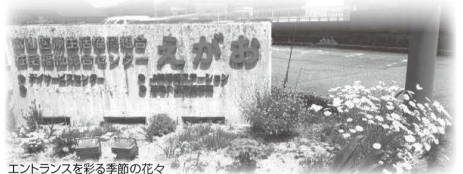
エントランスを彩る季節の花々