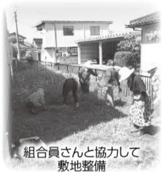
組合員さんと協力して敷地整備

あります。また、デイサービスでは日頃から利用者さんが自主的な活動を行えるよう、入浴の待ち時間や昼食までの余暇時間を利用して、間違い探しや計算、色塗りプリントなどの認知症予防の他、エスカルゴ(足漕ぎマシン)や足裏マッサージの機器を個別のリハビリテーションとして準備し、足の筋力低下予防にも努めて頂いております。