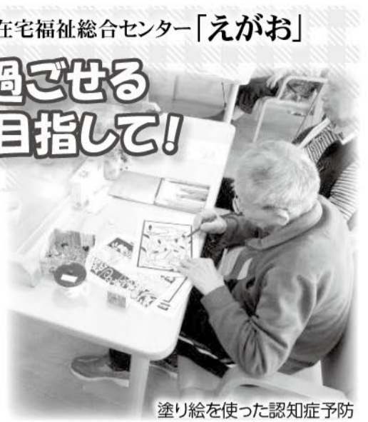
塗り絵を使った認知症予防

新型コロナウイルス感染症の制限がなくなり一年が経過しました。依然として事業所利用時はマスクの着用をお願いしていますが、活動においては外出イベントやボランティアの方々による催しが再開し、コロナ禍前の活気を取り戻しつつ