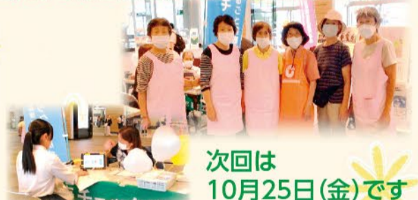
次回は10月25日(金)です