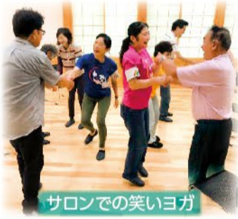
サロンでの笑いヨガ

皆さん素敵な笑顔で沢山笑ってくださいました。「自宅が崩れて入れないが中に愛猫がいる。毎日エサをあげに行くのが生きたい」と話される方がいらつしゃいました。