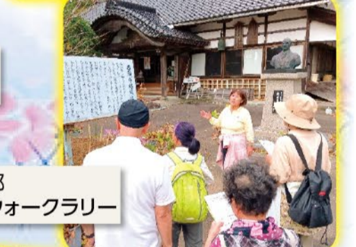
婦中支部 各願寺ウォークラリー