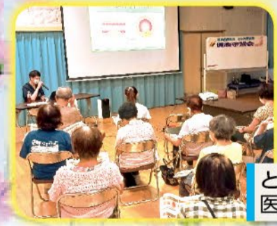
となみ野 医師講師の学習会

内視鏡 趣味と言っても色々あって、思い思いに打ち込んでいる方もお在りでしょう。何かに熱中し、打ち込める、あるいは没頭できることの利点を挙げれば、先ず人生の友と成り「満足感・リフレッシュ・脳の活性化」が得られる。また新しい自分を発見したり、自身でさえ気付かなかった才能を引き出せるかもしれない。最初は戸惑っても、次第にコツを掴み、天望が開ければ、しめたもの、上達と共に意欲も出て、達成欲も沸き、技量も上がる。運動・囲碁将棋・文芸・美術・手芸など、部門に依っては展示会、発表会、投稿など人前に披露の機会も有ろう。趣味の仲間との交流で、経験談や知識を取得すれば次への原動力につながる。また近頃出版物でよく目にするのが「パズル数独(すうどく)」です。世界規模の選手権大会が開かれる程。多くの方が親しんで居るらしい。また本誌にはクロスワードパズルが長年に渡り毎号載せて在り、これに挑戦されている方も在るでしょう。このクイズは読解力・語彙力・古典知識・現代知識、記憶力などが蓄えられるという。興に乗れば、夢中に取組める趣味ですね。(M)