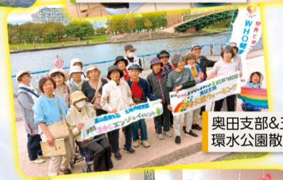
奥田支部&五福神明支部 環水公園散策