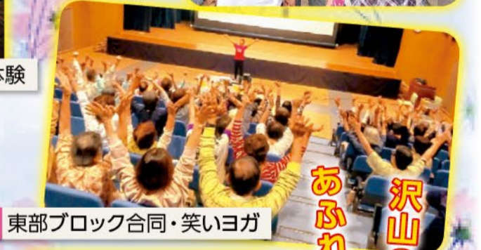
東部ブロック合同・笑いヨガ