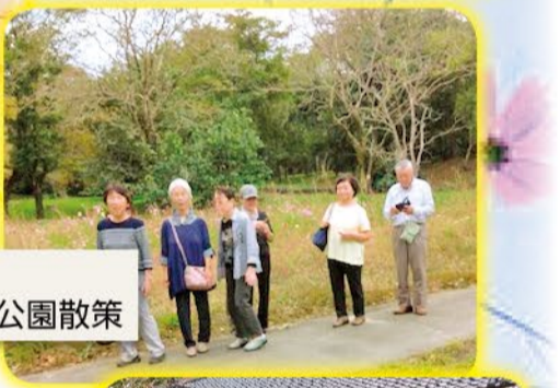
桜谷支部 北代緑地公園散策