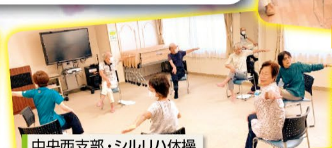
中央西支部・シルリ八体操