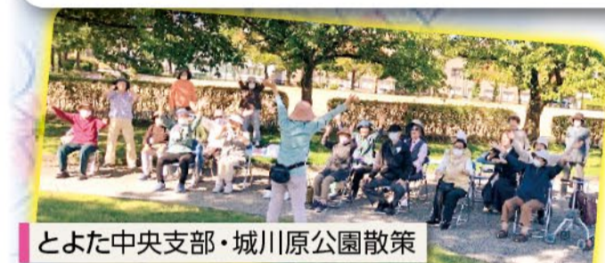
とよた中央支部・城川原公園散策