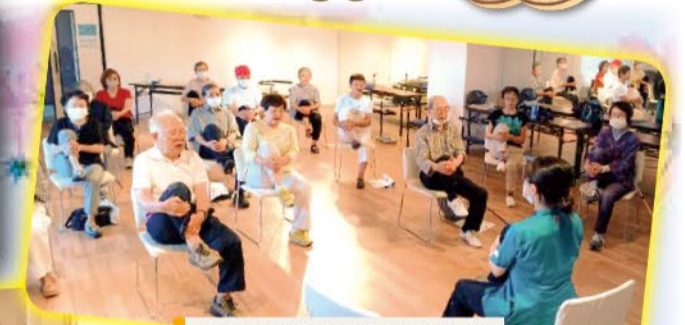
南部支部・シルリ八体操

今年から「WHO まめにエンジョイイベント」と名付け皆さんが集い、楽しく実施しています。これまで「WHO 世界と歩こうウォークイベント」としていましたが「歩くこと」に限らず、屋内で脳いきいきトレーニングやストレッチ運動で身体も頭も動かせる内容や、健康学習会など幅広く「健康になるための集会」を目指そう!とスタートしたところ、それぞれの支部で色々な形のエンジョイイベントとなっています。