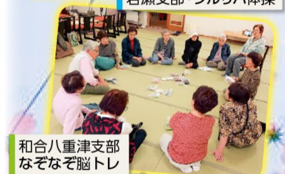
和合八重津支部 なぞなぞ脳トレ