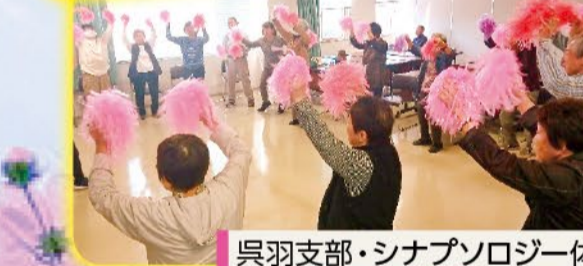
呉羽支部・シナプソロジー体験