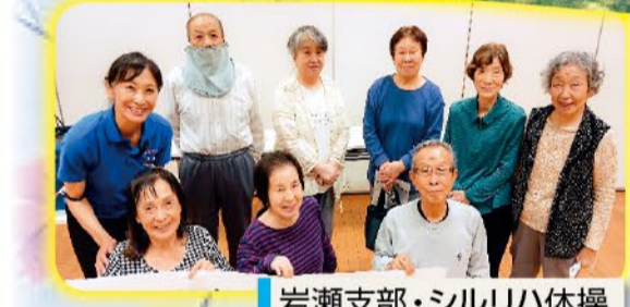
岩瀬支部・シルリ八体操