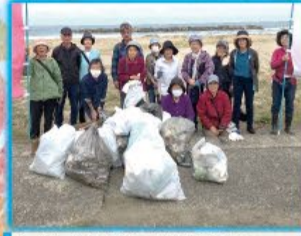
とよた4支部合同・海岸清掃ウォーク