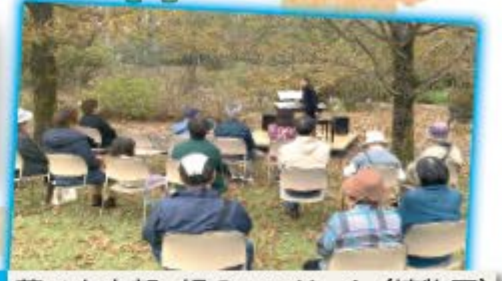
藤ノ木支部・緑のコンサート(植物園)

10月から「WHO まめにエンジョイイベント」が各支部で実施されています。どの支部でもたくさんの方に参加いただき、温泉で輪投げ大会や、植物園での脳トレ、屋外でのコンサートなど昨年よりも多彩な取り組みが報告されています！