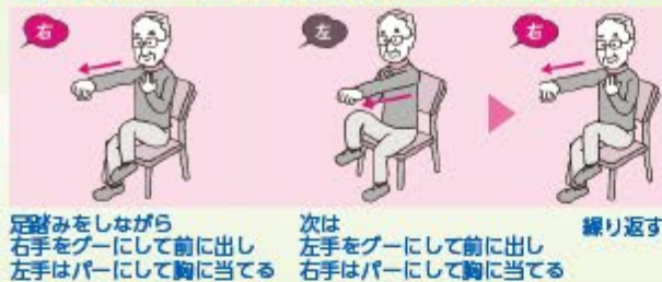
足踏みをしながら右手をグーにして前に出し左手はパーにして胸に当てる 次は左手をグーにして前に出し右手はパーにして胸に当てる 繰り返す