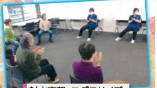
射水支部・コグニサイズ