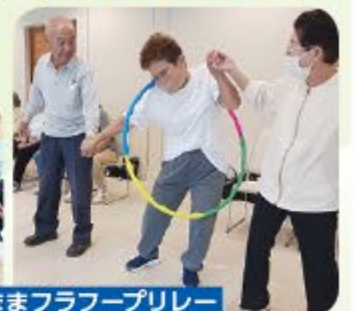
健康づくり委員会