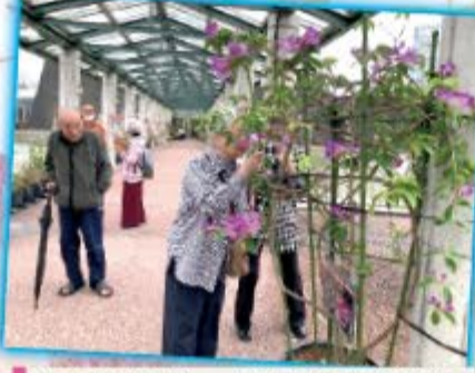
中央東支部・中央植物園散策