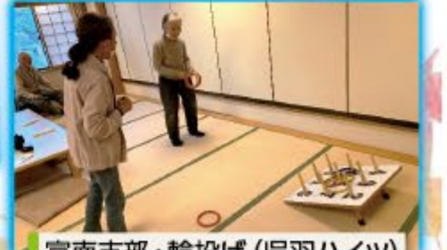
富南支部・輪投げ(呉羽ハイツ)