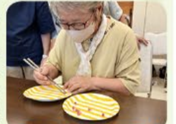
豆つぶ着つかみ競争

チーム対抗戦ということで、気合十分の皆さん。まずは自己紹介をし合いながら苗字の50音順に並ぶゲームからスタートし、全4つの競技に挑戦していただきました。「学習」とは違い頭も身体も思いっきり動かしてみなさんハッスル!「楽しすぎた!」「支部でもやってみよう!」との声をいただき文字通りの「交流会」を楽しく体験していただきました。