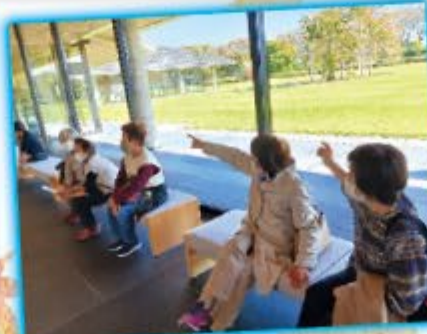
大広田支部・水墨美術館鑑賞