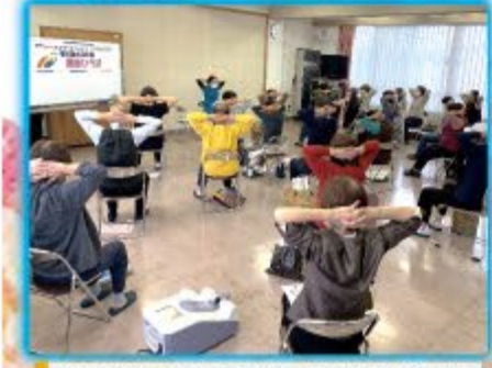
堀川南太田支部・健康ひろば