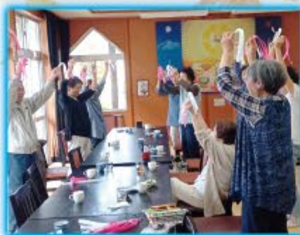
やくし支部・脳トレ体操