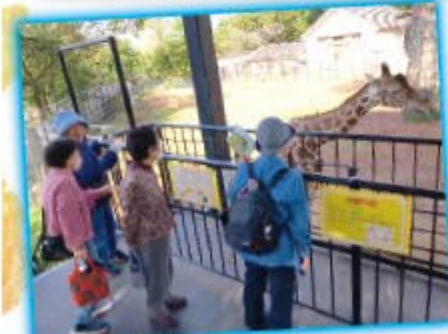
和合ローズ支部・ファミリーパーク散策