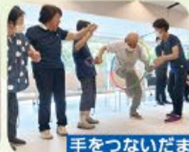
手をつないだままフラフープリレー