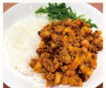
栄養科 柴田 真弓