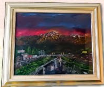
油絵 「暁の剱岳」 萩原 隆 (上市支部)