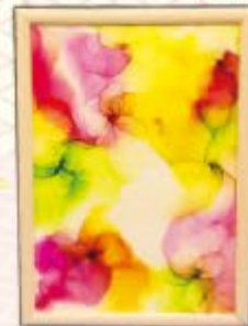
中島 碧優 (藤ノ木支部)