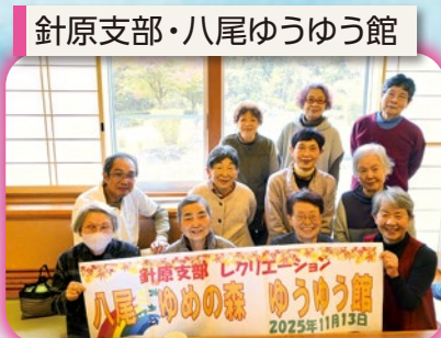
針原支部・八尾ゆうゆう館