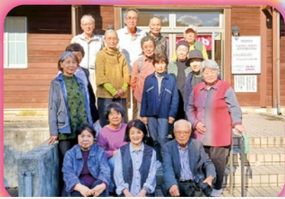
浜黒崎支部・吉峰グリーンパーク