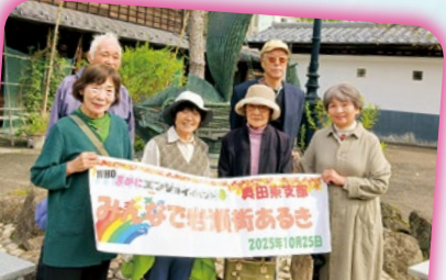
奥田東支部・岩瀬まち歩き