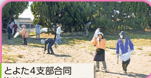
とよた4支部合同 海岸クリーンウォーク

支部レクリエーションとして毎年夏に戦争を考える企画を開催しています。今年は戦後八十年の節目であり、皆さんと戦争と平和を考える時間を過ごしました。今年作成された「未来に語り継ぐ 富山大空襲の記憶」というDVDで、語り部の方々が幼かった時の体験を赤裸々に語られ「あれは人殺しだと吐き捨てるように言われた方もいました。高校生の活動団体の皆さんの様子もあり、親子三代で語り継ぐ意思に胸を打たれました。鑑賞後には皆さんと席を丸くして懇談会をしました。皆さんもまだ幼かった時ですが