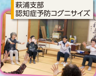
萩浦支部 認知症予防コグニサイズ