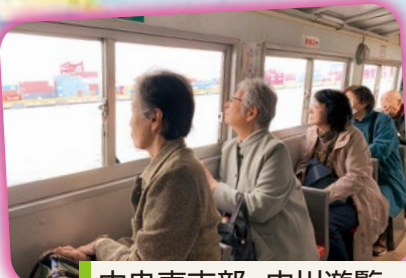
中央東支部・内川遊覧