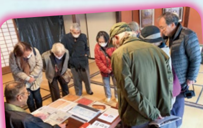
富南支部・城端善徳寺